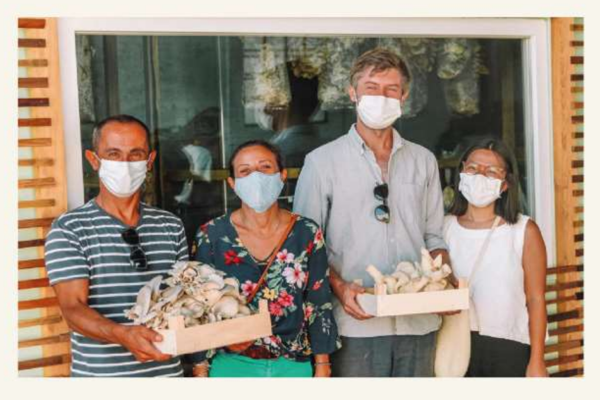
Build the largest Community of Circular Urban Farmers in Portugal.