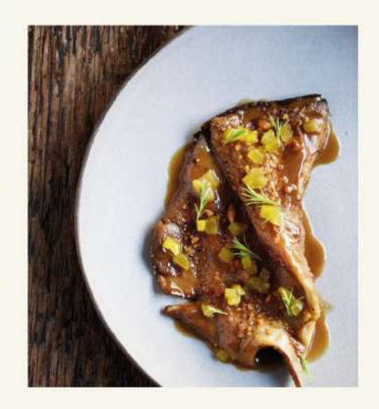
We are on a mission to reconnect people with their food.