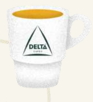
Adicionamos um bocadinho de água a farver • e transformam-se num delicioso café