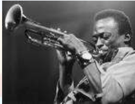
Miles Davies 1926 – 1991