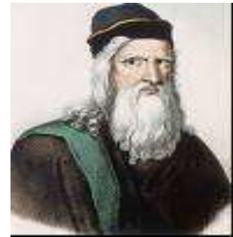
Leonardo da Vinci 1452 - 1519