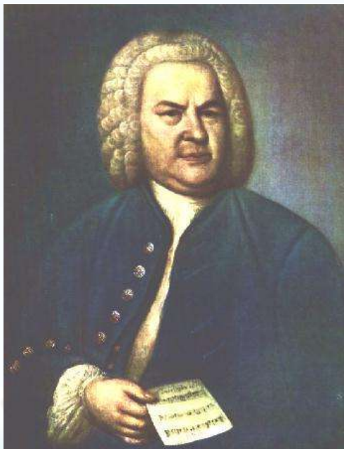
J.S. BACH (1685 – 1750)